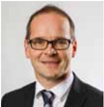
Grant Hendrik Tonne Niedersächsischer Kultusminister

Auf dieser Grundlage werden Sie eine fundierte Entscheidung für den weiteren Bildungsweg Ihres Kindes treffen können. Ein glückliches Kind, das den Anforderungen der gewählten Schulform motiviert begegnet, sollte das gemeinsame Ziel sein.